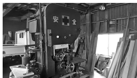
いまでも一部の製品に関しては 社内にてカットしております。