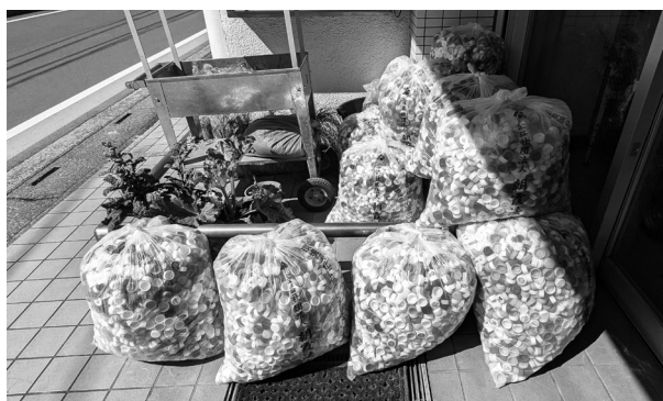
回収済みエコキャップ

女性部会の通年活動である「エコキャップ」回収運動につき、令和7年度も女性部会の皆様のご多大なるご尽力によりエコキャップ13袋(50,500個)を回収させて頂きました。エコキャップはNPO法人エコキャップ推進協会へ提供させて頂きました。令和8年度も通年活動として取り組んでいきますので引き続き皆様のご協力をお願いします。