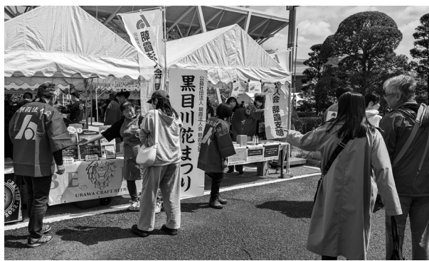
第20回黒目川花まつり

令和7年3月28日(土)・29日(日)に「第20回黒目川花まつり」が開催されました。3月28日(土)、3月29日(日)は晴天に恵まれた為来場者も多く、朝霞法人会テントにてホットドッグの販売や税の啓発用の小冊子の配付、「さいたま緑のトラスト基金」に対する寄付金の呼びかけを実施しました。ホットドッグは役員の皆様のご協力を頂き両日で433ケを販売し、売上金は寄付金とともに「さいたま緑のトラスト基金」に寄付致します。ご協力頂きました役員の皆様にご心より感謝申し上げます。