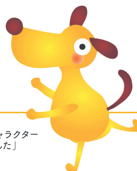
法人会キャラクター 「けんた」